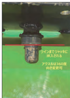
ガレージジャッキへの取り付け部 構造 (360度向き変更可)