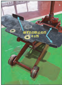
考案した治具の全景

落下防止対策として、ガレージジャッキ受け皿を新規製作した専用治具に付け替えられる構造としました。(フォークリフト1～2トン系と3～4トン系の2種類を製作)