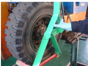
タイヤを脱着する時はこれを 付ける